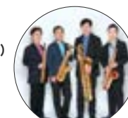
トルヴェール・クワルテット